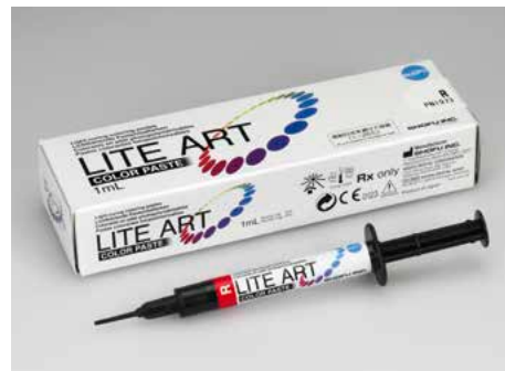
Best.-Nr. 1971 - 1985