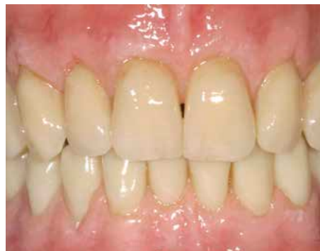
OK-Zähne 13-23 und Gingiva mit LITE ART und Ceramag individualisiert.