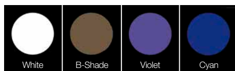
Unter natürlichen Lichtverhältnissen

LITE ART Pastenmal Farben sind in Übereinstimmung zu den natürlichen Zähnen hoch fluoreszierend. Ihre natürliche Wirkung bleibt selbst bei künstlichen Lichtverhältnissen erhalten.