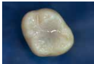
Alfacomp LC als Verschluss der Trepanationsöffnung