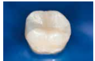
Alfacomp LC (mesial-okklusal) im Vergleich zu einer GrandioSO Füllung (okklusal-distal)