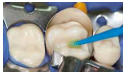
Benetzen der Kavitätenwände mit Futurabond DC