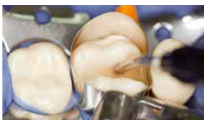
... und 4 Millimeter mit x-tra base füllen