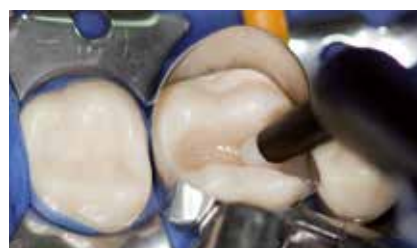
2 Millimeter Deckschicht GrandioSO einbringen