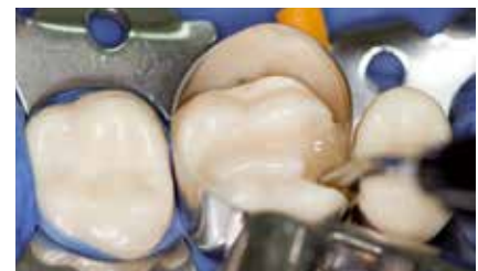
Am tiefsten Punkt der Kavität ansetzen ...