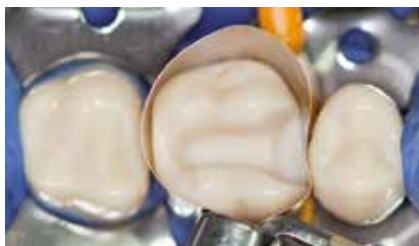
Fertig präparierte Kavität